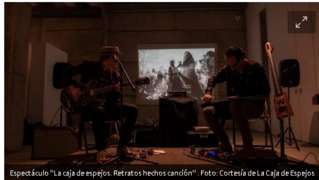
Espectáculo “La caja de espejos. Retratos hechos canción”.