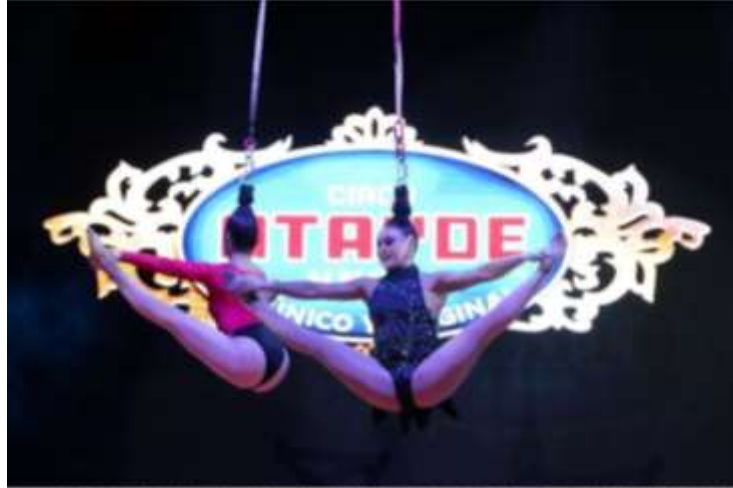
Acrobatas en Festival de Primavera exhibieron sus espectáculos del Circo Atayde, como parte de presentaciones del Festival de Primavera. Crédito: Alejandro Méndez