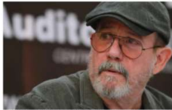
Silvio Rodríguez en un momento de su presentación en el Zócalo de la Ciudad de México.