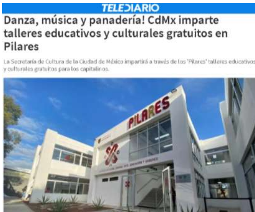
Redacción Ciudad de México. / 28.05.2022 21:59:00

Las vacaciones de verano se acercan, y si aún no sabes qué hacer para evitar el aburrimiento, ¡no te preocupes!, la Secretaría de Cultura de la Ciudad de México imparte clases gratuitas a cualquier persona que esté interesada en aprender algo nuevo.