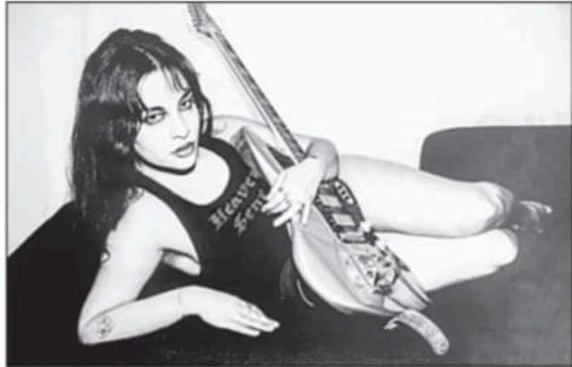
A la intérprete se presentará en abril, por primera vez, en el Festival Coahuila.

Junto con el trio madrileño Cariflo, realizaron el tema Locoñon , la cual hace referencia a una persona atrevida, según los medios españoles “es una canción pegadiza con