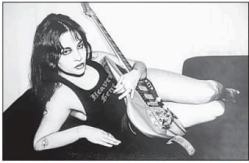
A la intérprete se presentará en abril, por primera vez, en el Festival Coahuila.