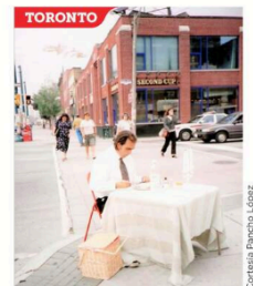
Sobre estas líneas, en plena calle en Toronto, Spadina Ave. y Richmond St.