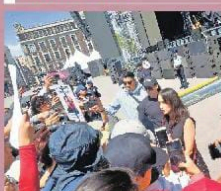
Previo al concierto, la cantautora tijuanaense habló con padres de personas desaparecidas.

“Sabemos lo que es ser una mujer mexicana, tener miedo” JULIETA VENEGAS Cantautora