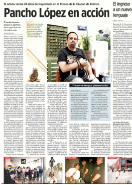
El artista revisa 25 años de trayectoria en el Museo de la Ciudad de México. El ingreso a un nuevo lenguaje.