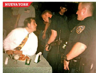
También llevó su "picnic" al metro neoyorquino; creyó que los guardias lo retirarían del sitio, pero lo dejaron continuar.