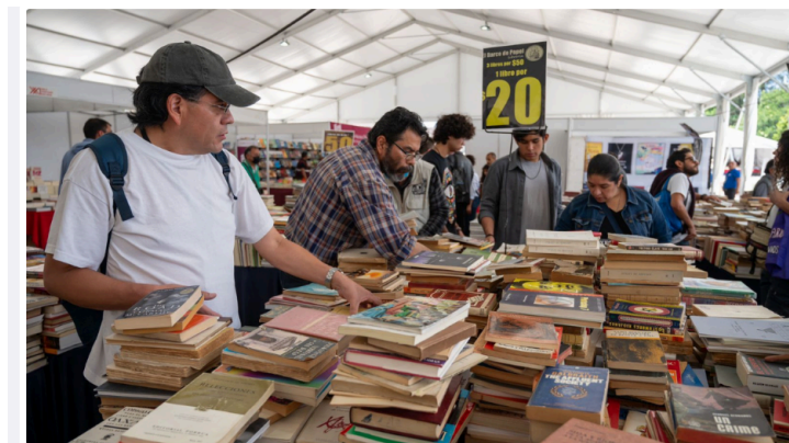
¡LLEVELE, LLEVELE! ANUNCIAN REMATE DE LIBROS Y PELÍCULAS EN EL MONUMENTO A LA REVOLUCIÓN

¡Guarda la morralla! La Secretaría de Cultura de la CDMX informó que 17ª edición del Gran Remate de Libros y Películas se llevará a cabo del 27 al 31 de marzo en el Monumento a la Revolución, con precios que van desde los 10 hasta los 150 pesos