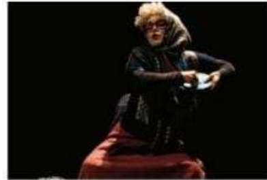
Una escena de la obra.