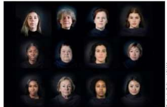
El Aleph arrancará actividad con la instalación Face to face , en el Colegio de San Ildefonso, del artista británico Brian Eno.