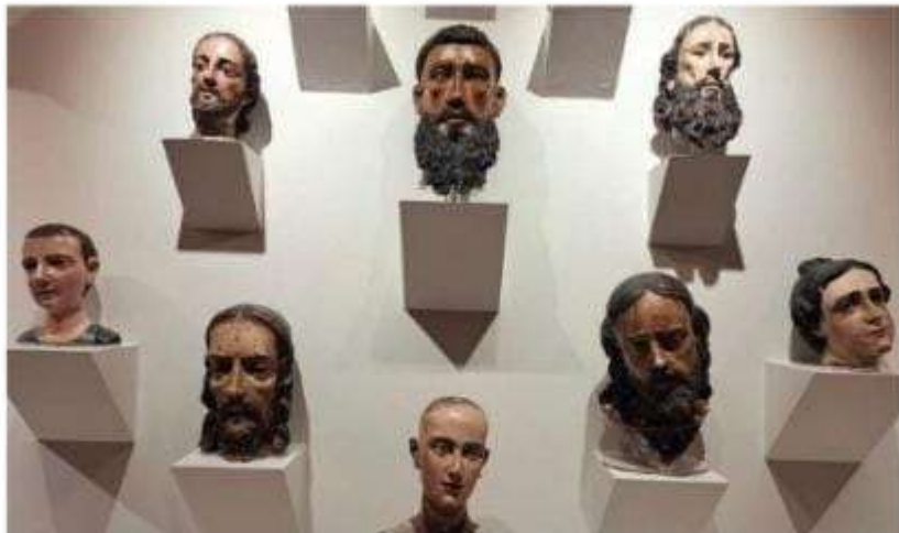
Algunas de las piezas en exhibición.

Es por ello que el propósito de la muestra, que inaugura este sábado a las 13:00 horas, es ilustrar y difundir el enorme reto que se tiene a nivel nacional y mundial ante la sim-