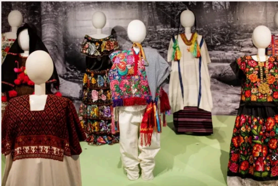
Textiles tradicionales mexicanos.