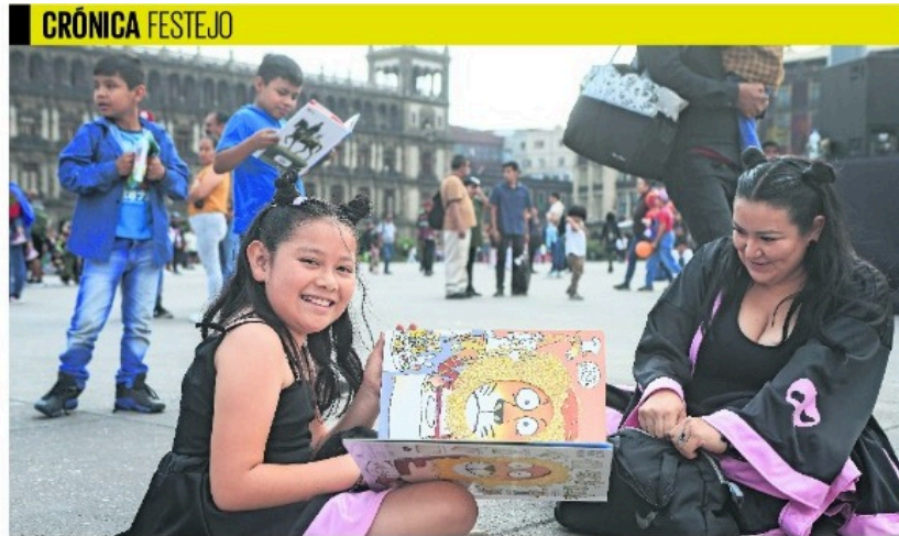
Los asistentes al festejo en el Zócalo disfrutaron de actividades con libros, globos y burbujas. Concluyeron alrededor de las 18:30 horas.