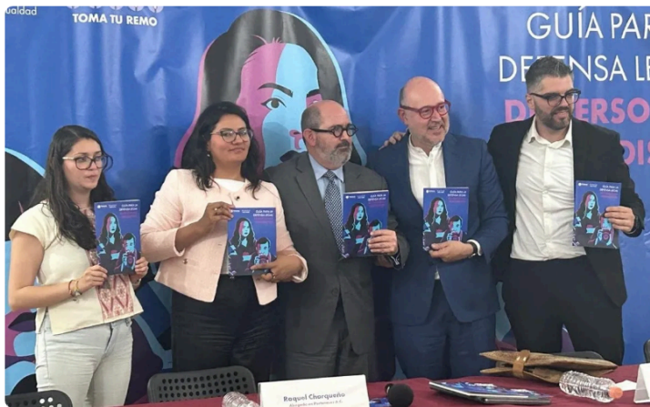
11 Presentan Guía para la Defensa Legal de Personas Periodistas en Casa Refugio Citlaltépetl

Mantente informado sobre lo que más te importa