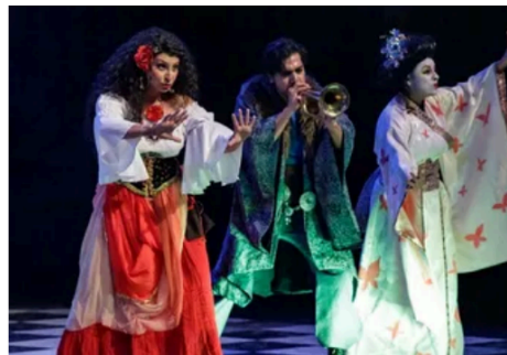
No se necesita ser alguien aficionado a la ópera, cualquier persona puede disfrutarla | Foto: Especial

La puesta en escena está dirigida al público infantil y retoma a personajes clásicos como Carmen y Madama Butterfly.