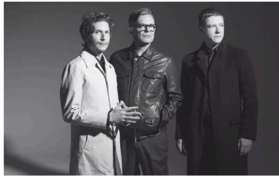
Interpol, banda neoyorquina de Indie Rock, se presentará en el Zócalo de la CDMX.

La banda estadounidense de indie-post punk Interpol ofrecerá un concierto gratuito en la Ciudad de México .