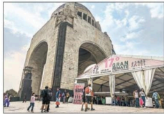
El encuentro editorial se realizó del miércoles 27 al 31 de marzo. Al cierre de esta edición aún no se especificaba cuántos títulos se habían vendido.

Más de 171 mil apasionados de las letras y el cine asistieron al Monumento a la Revolución, informaron autoridades