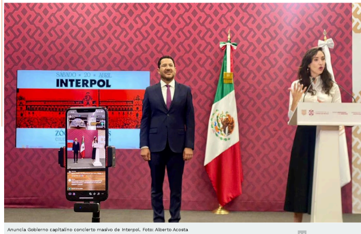
Anuncia Gobierno capitalino concierto masivo de Interpol.

El próximo 20 de abril de este año, se llevará a cabo en la explanada del Zócalo capitalino un concierto masivo gratuito