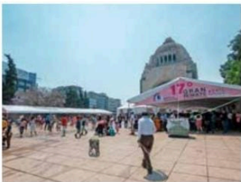
● CITA. Fueron cinco días de remate.