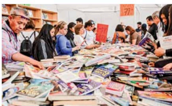
CRECE AFLUENCIA