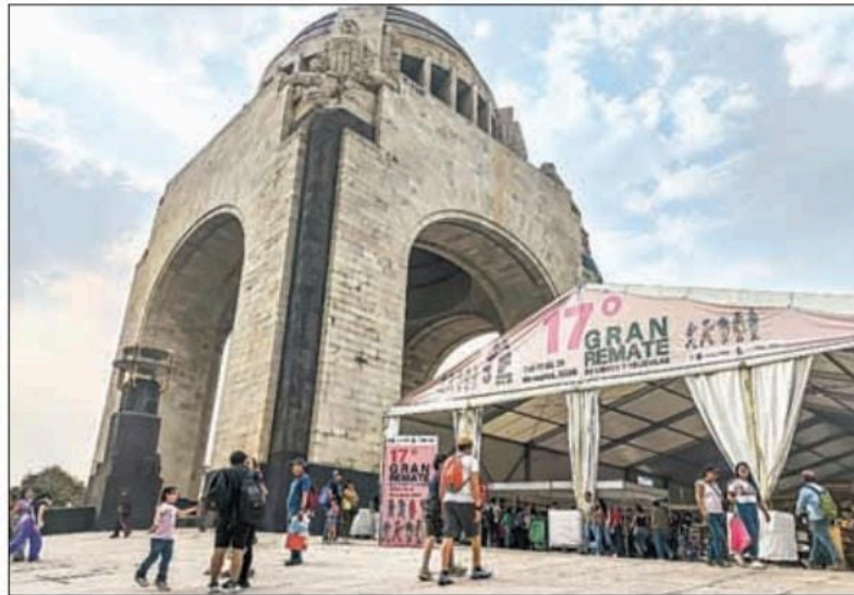
El encuentro editorial se realizó del miércoles 27 al 31 de marzo. Al cierre de esta edición aún no se especificaba cuántos títulos se habían vendido.

Más de 171 mil apasionados de las letras y el cine asistieron al Monumento a la Revolución, informaron autoridades