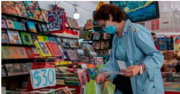
Los precios van de los 10 a los 150 pesos.

Permanecerá del miércoles 27 de marzo al domingo 31 de marzo en un horario de 11:00 a 20:00 horas