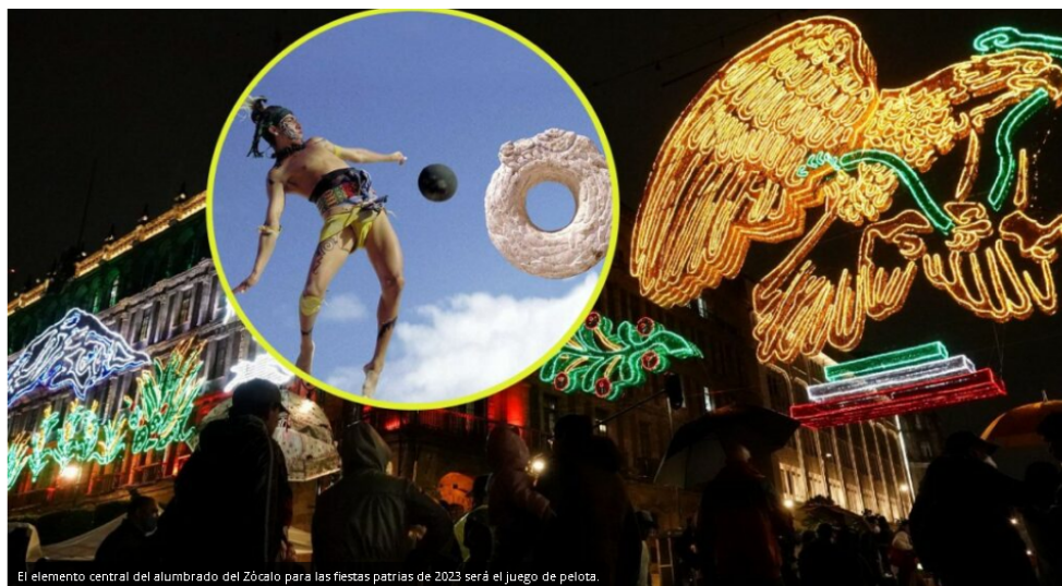
El elemento central del alumbrado del Zócalo para las fiestas patrias de 2023 será el juego de pelota.