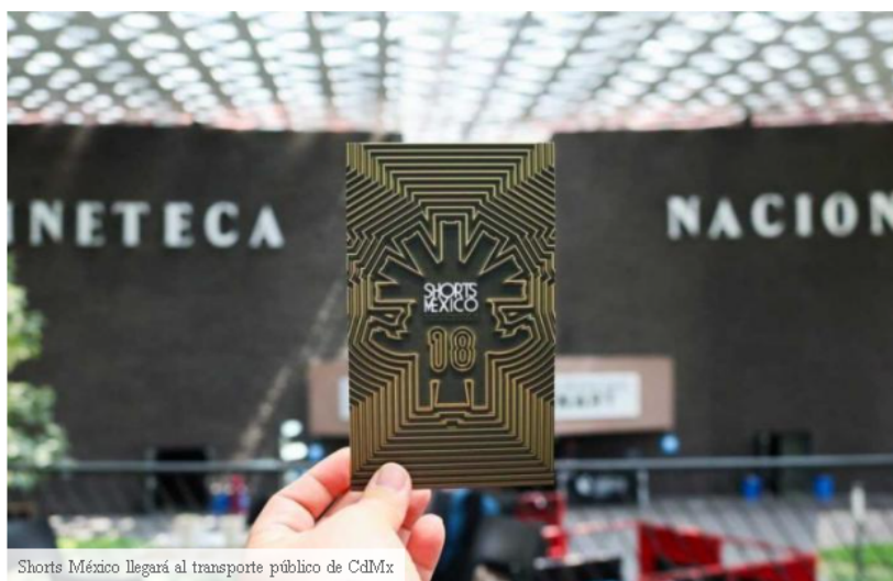
Shorts México llegará al transporte público de CdMx

SALUD Betty Noticias about 19 hours ago REPORT