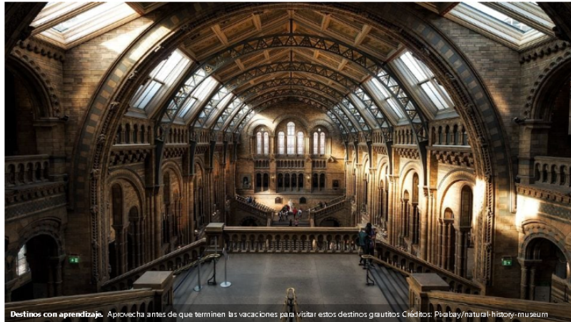
Destinos con aprendizaje. Aprovecha antes de que terminen las vacaciones para visitar estos destinos gratuitos.

Opciones imprescindibles para que pases una tarde llena de diversión y aprendizaje en sitios emblemáticos