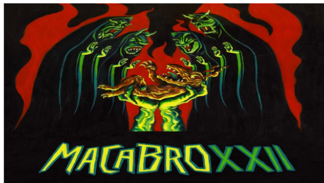
El Festival Macabro XXII comenzó el 17 de agosto y terminará el 27 del mismo mes