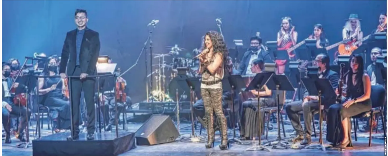
dirigió el concierto con música de Guns N' Roses

Esta temporada, los villancicos y canciones navideñas invaden desde los pasillos de los centros comerciales y cafeterías, hasta las salas de concierto y grandes auditorios. Como una alternativa