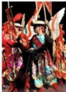
Todos a Belén arribará en enero al Teatro de la Ciudad.