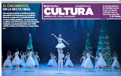
Laufey, multiinstrumentista y cantante islandesa, abraza el espíritu decembrino