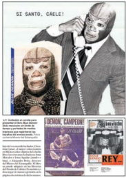
Los Rose no diferenciará una nada de prensa antes de recibir el Premio Nobel de Literatura