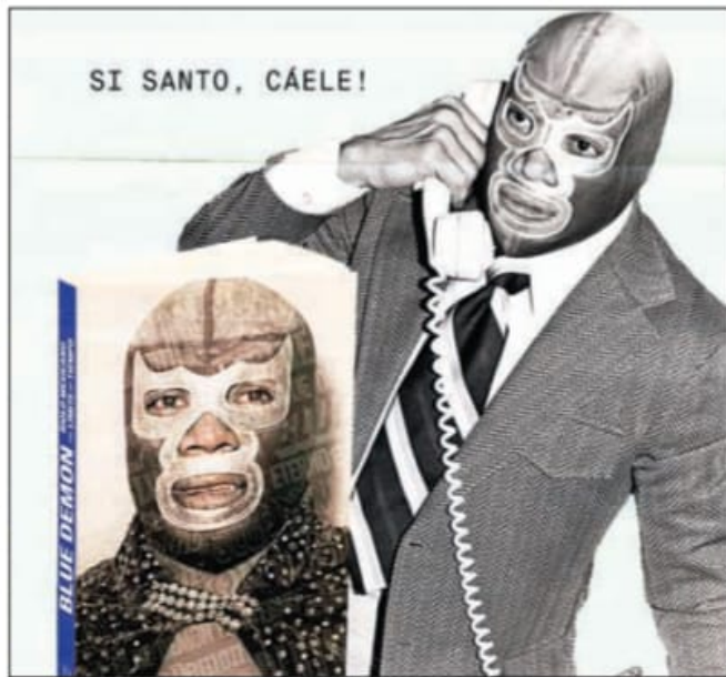
Invitación al convite para presentar el libro Blue Demon: Ídolo mexicano sin límite de tiempo y portadas de medios impresos que registraron las hazañas del enmascarado.