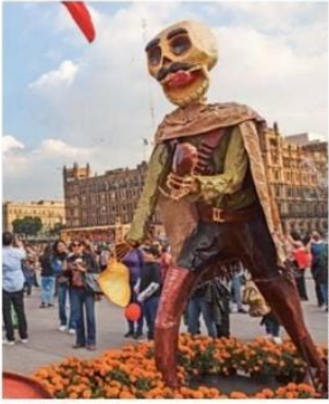
FECHA. Habitantes de la ciudad y turistas podrán asistir a la Ofrenda Monumental hasta el 5 de noviembre.

tivos, Vinculación Comunitaria, la Red de Fábricas de Artes y Oficios (Faros), los Puntos de Innovación, Libertad, Arte, Educación y Saberes (Pilares) y el Colectivo Xibalba.