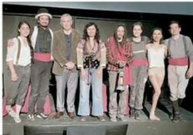
Ayer se dieron los detalles de la celebración por los 20 años.

"Decir 'hacer circo' en México es realmente un reto, no sólo en el sentido del reto personal que implica trabajar con tu propio cuerpo y lograr