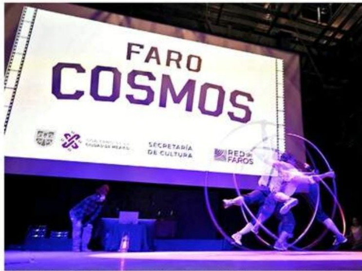
Escena de Luna Eva , obra que la compañía presentará este fin de semana en Karpa de Mente.