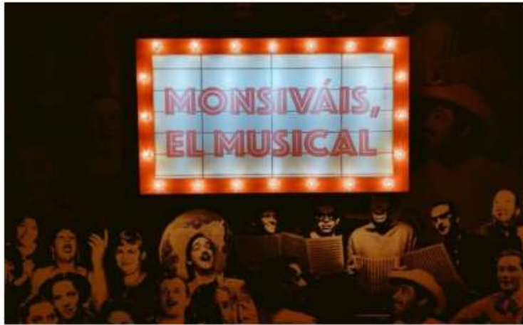
La exposición abre el 23 de noviembre y permanecerá hasta el 31 de julio de 2022.

Observó que la música sirve a Monsiváis para muchas cosas, desde referencias y guiños a los lectores, hasta para