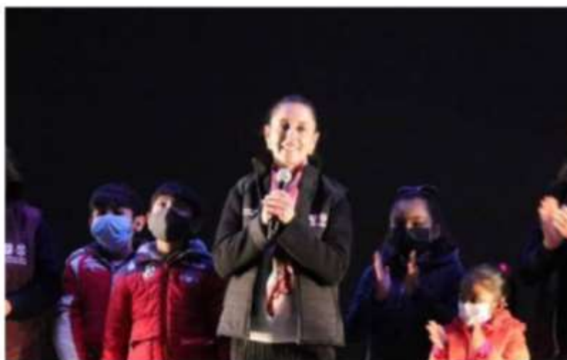
Este viernes la Jefa de Gobierno, Claudia Sheinbaum Pardo, inauguró el Primer Festival Vive Milpa Alta, Gastronomía, Arte y Cultura.

En el evento, la mandataria recordó que cuando llegó al gobierno de la Ciudad de México dijo que iba apoyar el campo cómo nunca antes.