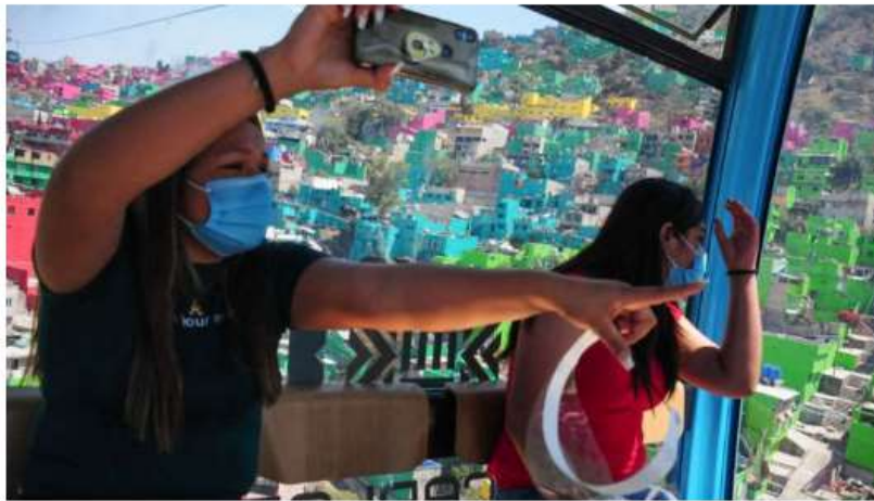
© Daniel Augusto Tienes del 22 de noviembre al 14 de diciembre para participar.

El Gobierno de la Ciudad de México lanzó el concurso Mi Cablebús a la Vista , donde el ganador recibirá más de 20 mil pesos. Aquí te decimos cuáles son los requisitos.