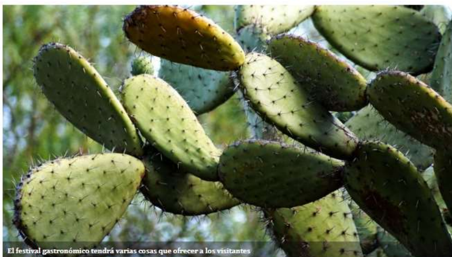
El festival gastronómico tendrá varias cosas que ofrecer a los visitantes

CARLOS NAVARRO NACIONAL - 18/11/2021 - 17:03 HS