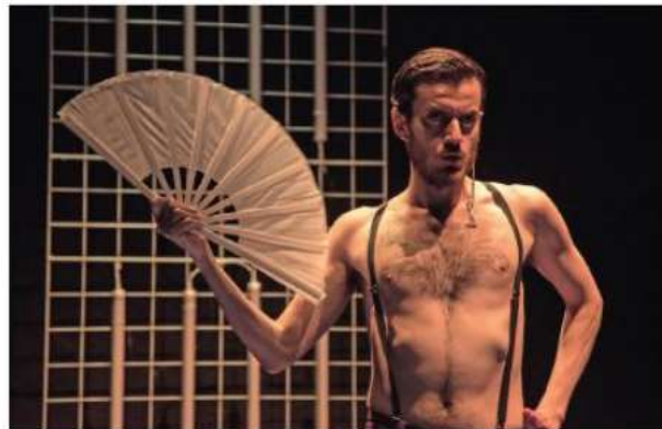
El espectáculo Fierce/ Fiera combina danza, teatro, música y cabaret y ofrece testimonios personales de portadores del VIH.