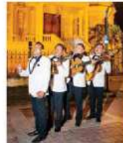
En la muestra artística participarán Los cuatro armónicos , músicos tradicionales.

De forma complementaria, el SACPC abrirá la exposición Creación en Movimiento. Generación